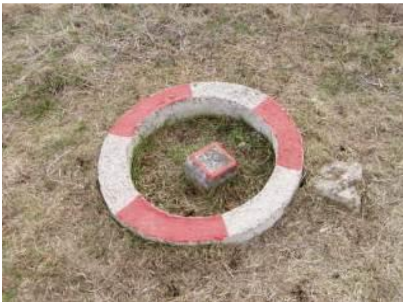
Stabilizace vnějších bodů (č. 31-35)