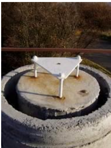
Detail nucené centrace, bod je definován středem otvoru v úrovni horní plochy kovové desky