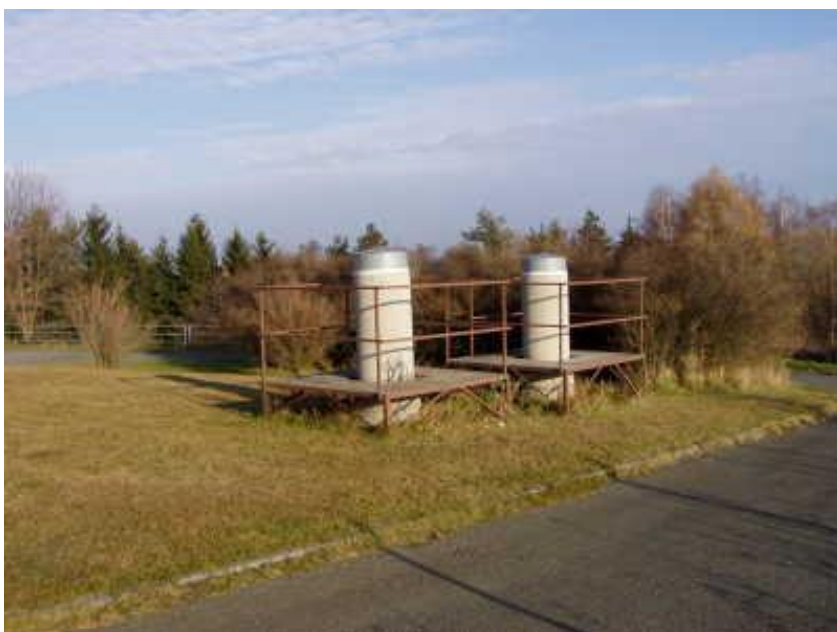
Stabilizace vnitřních bodů (č. 11-15)