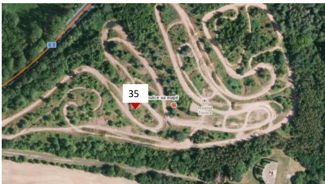
Bod 35 mezi obcemi Žďánice a Oleška