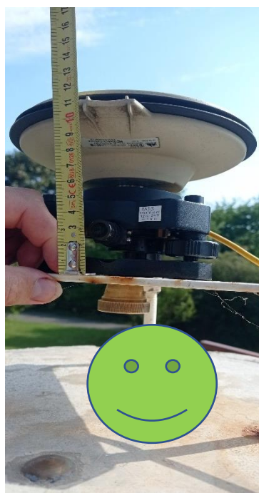
pro určení výšky antény u bodů s nucenou centrací nepoužívat pomocnou nivelační značku