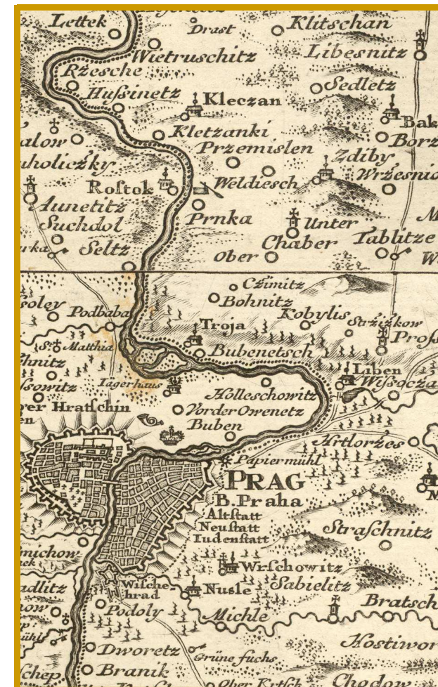
Z Müllerovy mapy Čech z roku 1720