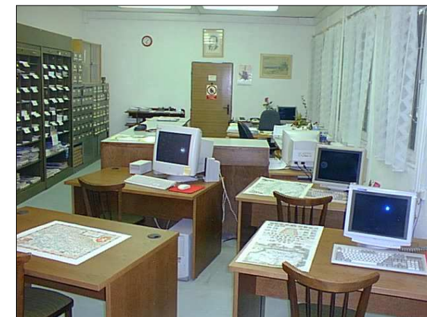
Ve studovně mají čtenáři přístup do elektronického katalogu knihovny a k informacím v Internetu

Knihovna vydává vlastní časopis " NOVINKY ZEMĚMĚŘICKÉ KNIHOVNY " - výběr z domácí i zahraniční odborné literatury, který má čtenáři k dispozici na URL :