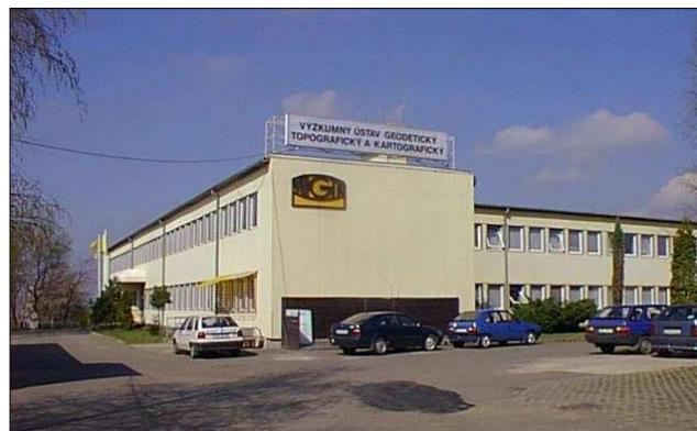
Zeměměřická knihovna je v budově VÚGTK ve Zdibech. Ze stanice Kobylisy - Metro C - trvá cesta 9 minut autobusy č. 370, 372, 373 - zastávka na znamení, Zdice, Výzkumný ústav